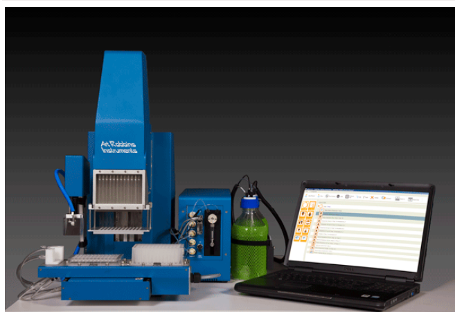
非接触型蛋白ナノ分注ヘッドを装着した 標準型の Gryphon 蛋白結晶化システム